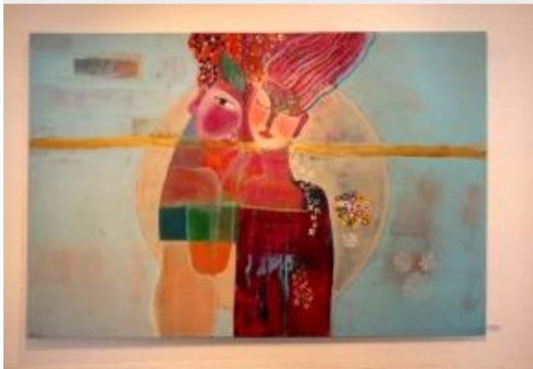
«Zwei», Mischtechnik auf Leinwand, von Marianne Chiu.