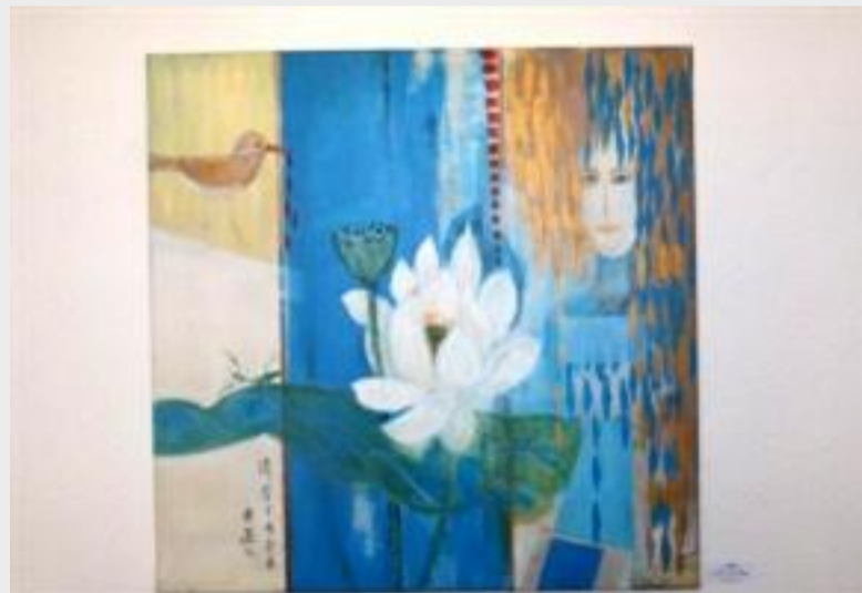
«Leben», Acryl auf Leinwand, von Marianne Chiu.