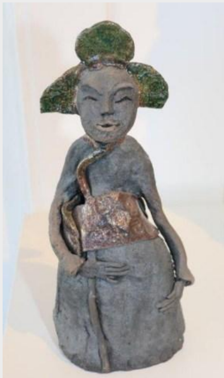
«Konkubine», Rakubrand, von Marianne Chiu.