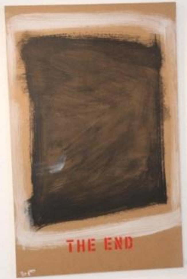
«Endlich», Mixed Media auf Karton, von Rosmarie Abderhalden.

Die Ausstellung in der Galerie zur alten Bank dauert bis am 18. September. Offen ist sie jeweils donnerstags von 18 bis 20 Uhr, samstags von 10 bis 12 und 14 bis 17 Uhr und sonntags von 14 bis 17 Uhr.