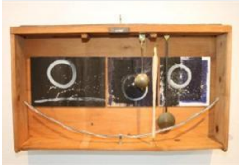
«Traumzeit», Gegenstände in einer alten Schublade, von Rosmarie Abderhalden.