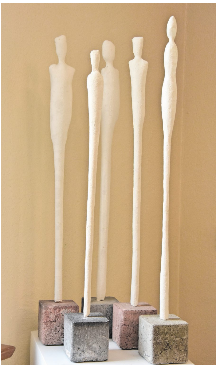
Diese Figuren hat Rosmarie Abderhalden aus Flachpapier geschaffen.

werden, sind neueren Datums – aus den Jahren 2015, 2016 und 2017, wie die Beschreibung verrät. Der Mensch steht als Thema im Mittelpunkt. Dies zeigt sich an den filigran geformten Figuren aus Flachpapier, aber auch an den kraftstrotzenden Körpern, die aus Drahtgeflechten geformt sind. Und auch in den kleinformatigen Collagen tauchen immer wieder Hinweise zum Motto auf: Gesichter, Münder, Augen.